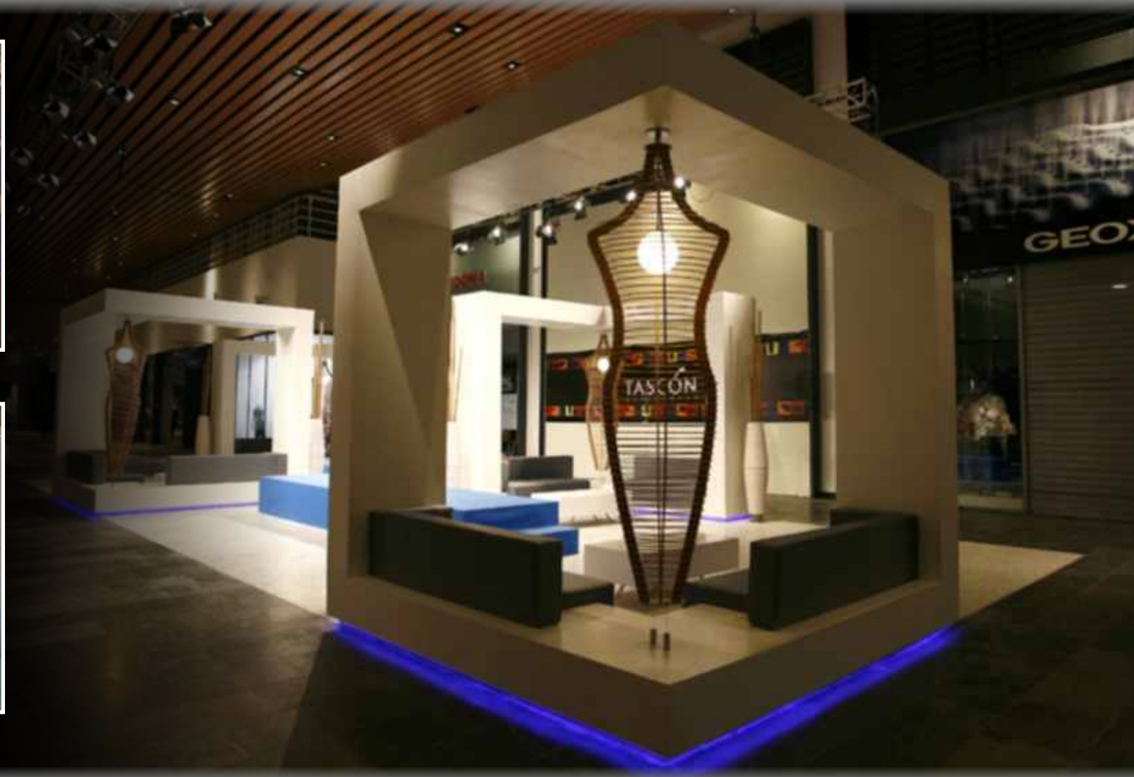
CC ISLAZUL: Diseño de iluminación para farolas interiores del centro, en LED de alta intensidad y pórticos en el Hall de Moda.